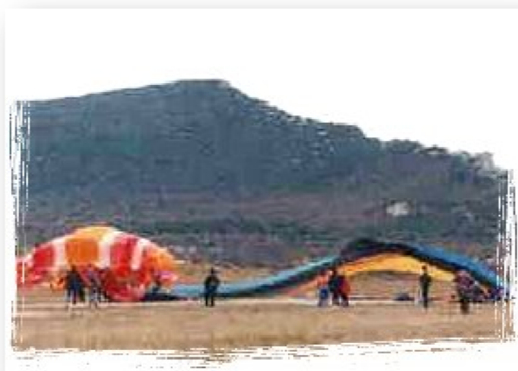
"Un cerf-volant mythique."